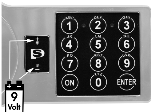
Plus- und Minuskontakt zur Notbestromung

ACHTUNG: Wird der Tresor nach einem vollständigem Spannungsausfall / vollständig leerer Batterie mittels externer Batterie geöffnet, muss nach dem Batteriewechsel das Elektronischs Schloss wie unter Punkt „Öffnen des Tresors“ angeführt geöffnet werden.